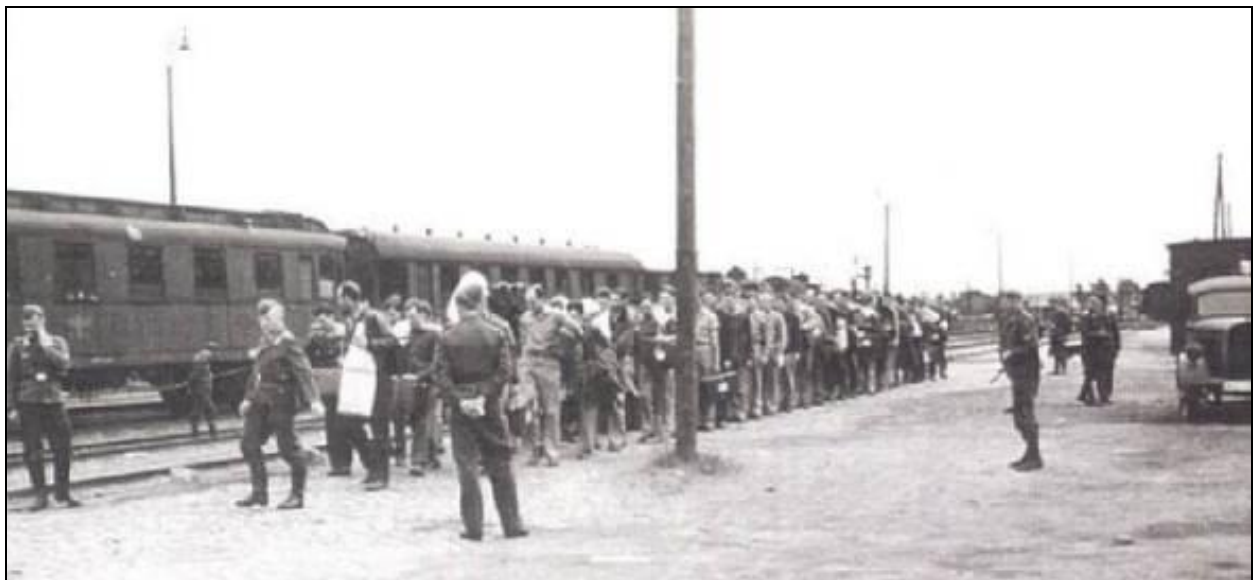
Krijgsgevangenen aankomst op het station in Barth Duitse bewaker, Heinrich Haslob.

De Stalag I was verdeeld in vijf afzonderlijke gebieden. Er waren vier gevangenis gebieden: Zuid of West, Noord 1, Noord 2 en Noord 3. Het vijfde gebied in het centrum, bestond uit de goed gebouwde Duitse dienstgebouwen.