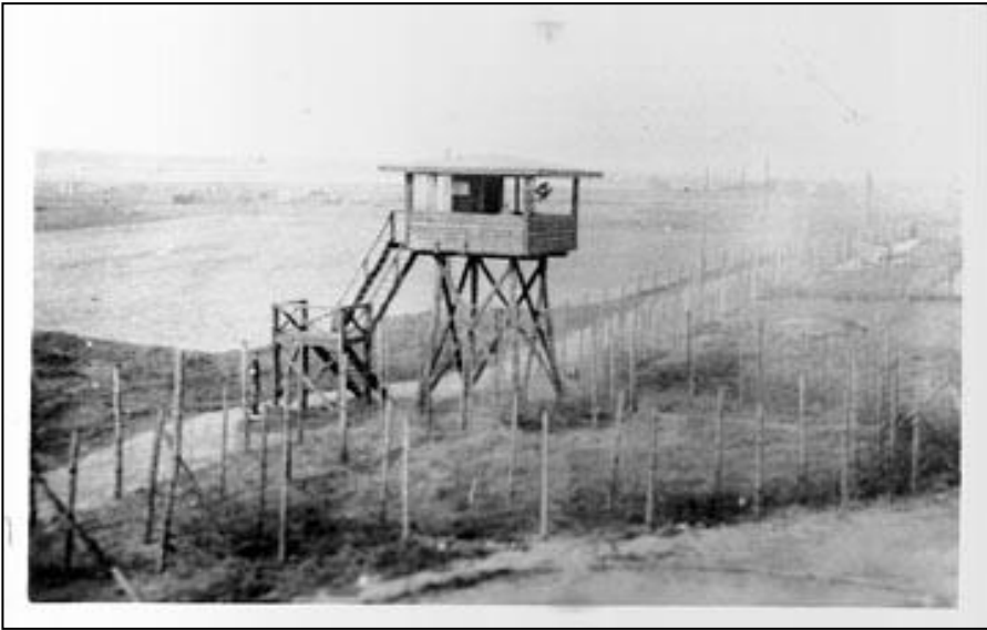
Stalag Luft I Guard Tower - Een van de vele wachttorens rond de 3 verbindingen in Stalag Luft # 1, Barth, Duitsland. Foto ongeveer genomen 10 mei 1945 na de bevrijding door de Russische opmars troepen van gepantserde divisie. Foto genomen door een Duitse camera in beslag genomen van burgers.

Kachel gebruikt voor het verwarmen van een van de vele grote kazerne kamers, het "thuis" voor 24 krijgsgevangenen (als we steenkool hadden gekregen- een rantsoen per persoon - wat zelden) was. Ook voor het koken.